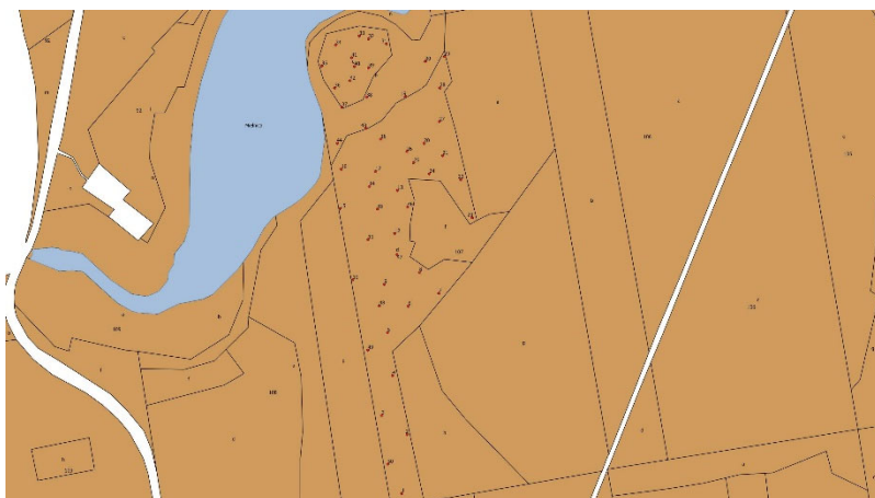
Figure S4. Location of sample trees in the stand MIE.