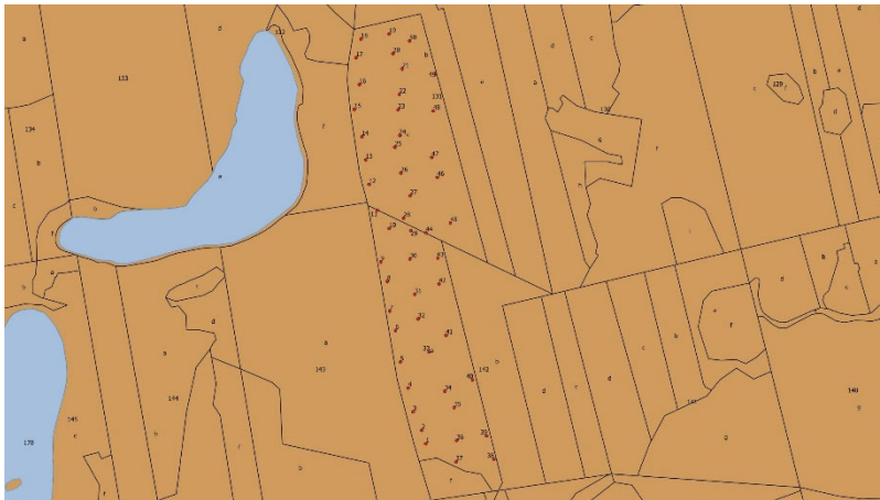
Figure S2. Location of sample trees in the stand GAC.