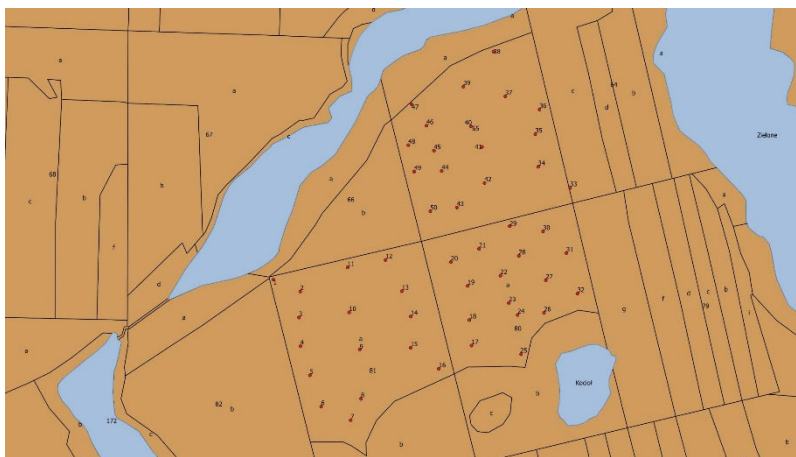
Figure S5. Location of sample trees in the stand KOC.