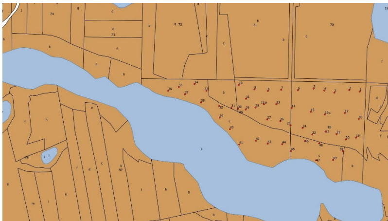
Figure S3. Location of sample trees in the stand PLE.